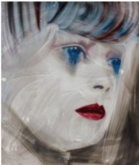
Rachael #2 (2012), öljy MDF-levylle. Turun taidemuseo.