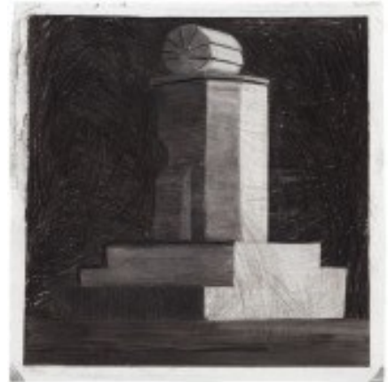
Observatorio XIX (2015). Hiili paperille. Kansallisgalleria. Nykytaiteen museo Kiasma.

SHADOWS AND STARDUST -sarjassa taiteilija on kuvannut eri puolilla maailmaa olevia observatorioita. Heiskan sanojen mukaan ”observatoriot ovat maapallon silmiä, joiden avulla yritämme hahmottaa olemassaoloamme. Yritämme selvittää, mistä olemme tulleet, keitä olemme ja mikä tämä paikka on”. Piirustusmateriaali hiili on tarkoin harkittu valinta; alkuaine hiili on olennainen osa elämän kiertokulkua, koska sitä esiintyy kaikkialla, missä on elämää ja orgaanisia yhdisteitä.