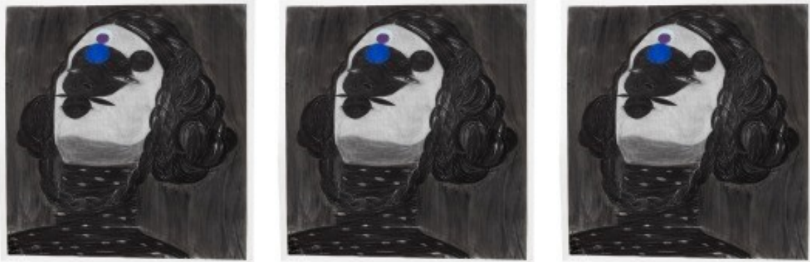
Camouflage II (2018), pastelli ja hiili paperille. Yksityiskokoelma.

TURUN TAIDEMUSEO ÅBO KONSTMUSEUM TURKU ART MUSEUM