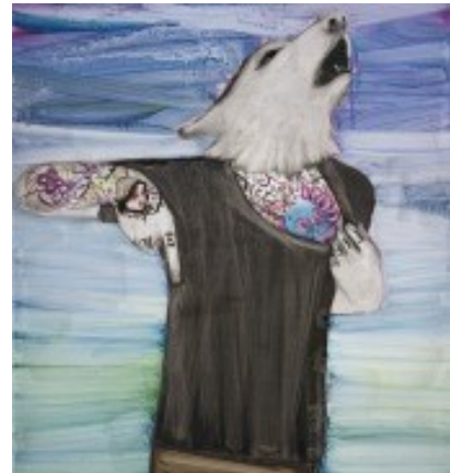
Howl at the Moon (2007), öljy mdf-levylle. Yksityiskokoelma.

NOT OF THIS WORLD -sarjaan kuuluvat teokset ovat kuvia ihmisen ja eläimen piirteitä omaavista hahmoista, jotka eivät ole kotoisin tästä maailmasta, niin kuin sarjan nimikin kertoo. Heiska on hakenut teoksiin inspiraatiota muun muassa musiikista: teosten englanninkieliset nimet ovat lainauksia hevi- ja goottibändien sanoituksista.